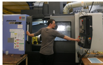
Préparation du CN avant usinage d'une pièce en titane.

totypage à la petite et moyenne série, Solufab maîtrise l'ensemble des process complexes d'usinage et notamment ceux relatifs aux matières difficiles (titanes, inconnus, etc.). Initialement tournée vers l'aéronautique, Solufab poursuit son développement en optimisant son outil de production pour conquérir de nouveaux secteurs. Dernier entré en date, le CN Doosan